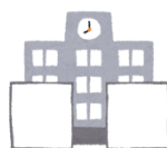
1976年以降に 専門学校 として設置認可

左記のように、学校の設置が1965年でも、専門学校として設置認可されたのが1976年以降のケースならOK